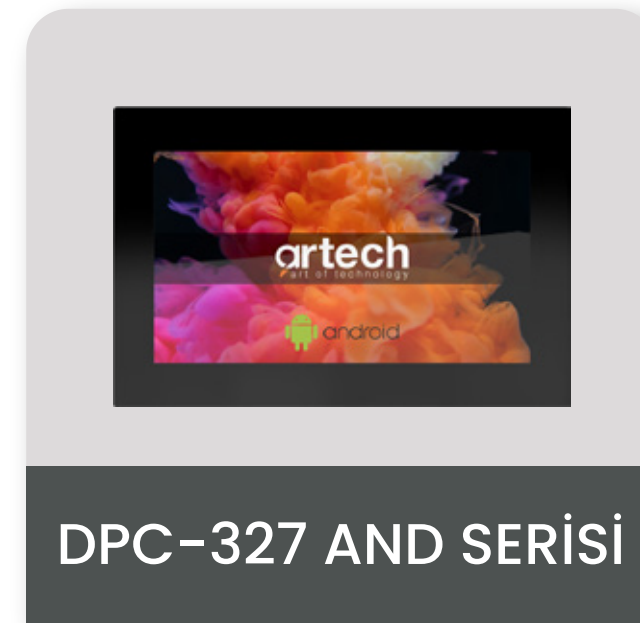
DPC-327 AND SERİSİ