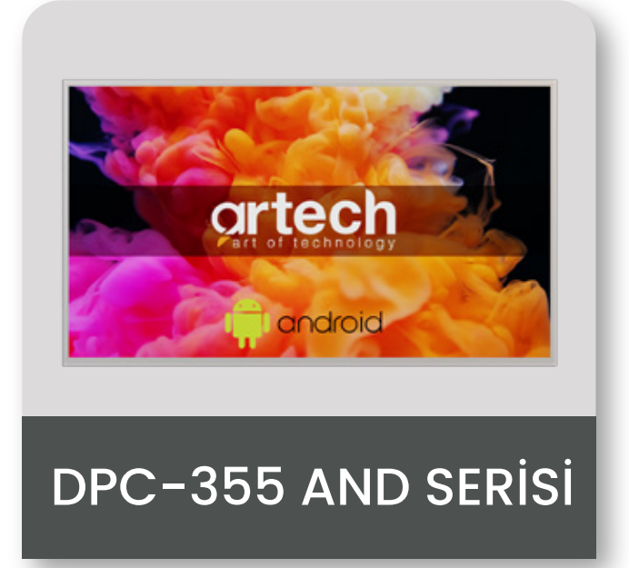
DPC-355 AND SERİSİ