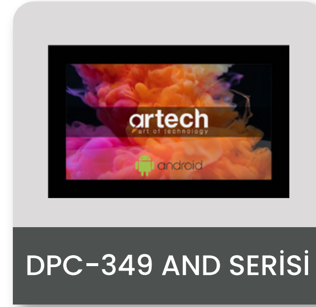
DPC-349 AND SERİSİ