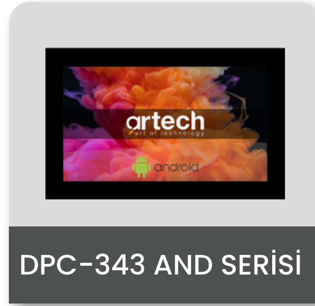
DPC-343 AND SERİSİ