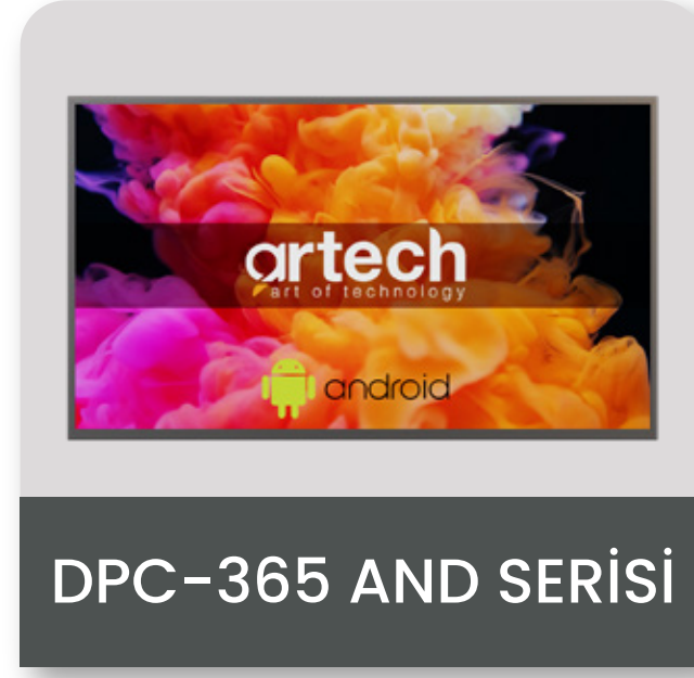
DPC-365 AND SERİSİ

ARTECH Profesyonel Digital Signage Ekranları hakkında detaylı bilgi için QR kodu okutunuz.