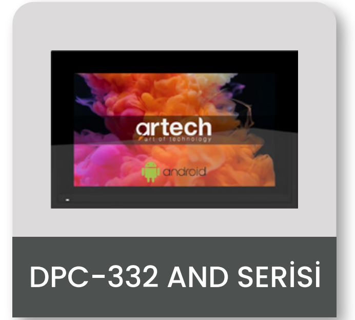
DPC-332 AND SERİSİ